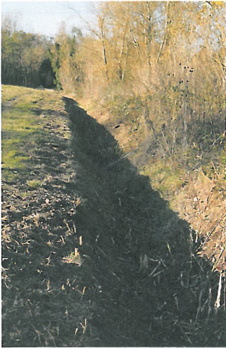
Fossé Nord et buse d'évacuation des eaux de ruissellement vers L'Estey de Franc