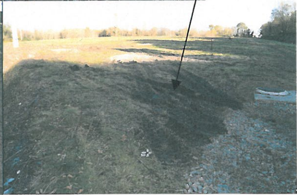
Event de biogaz