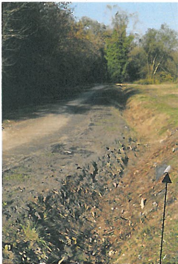
Fossé Ouest et buse d'évacuation des eaux de ruissellement vers L'Estey de Franc